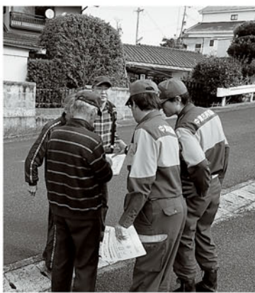
捜索模擬訓練の様子

実際に認知症の方が行方不明になった際は多くの方の協力が必要になります。訓練を通して、認知症の理解、気軽に声かけができる町づくりを目指し