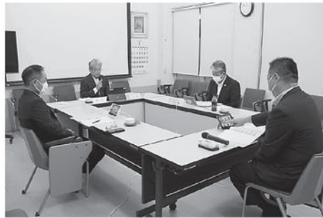
ミーティングルームの様子