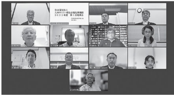
Web上の理事会の様子

また、今年度の定時評議員会が新型コロナウイルス感染症蔓延の影響により書面で行われ、第1号議案「2021年度事業報告（理事長の職務執行状況報告）」に関する件、第2号議案「2021年度決算報告及び監事監査結果に関する件」、第3号議案「特別養護老人ホームいずみの園 新・改築工事に関する件」について、評議員11名全員が全ての議案事項に係る提案に同意され、6月23日に決議があったものとみなされました。