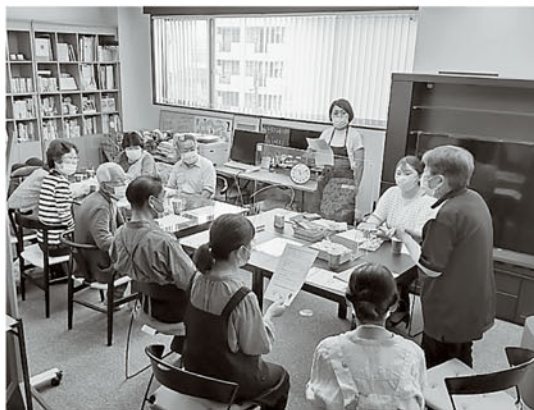
オレンジカフェなかつの様子

茶を飲みながら気軽に話しをしたりしています。また、ご参加される方のリクエストにお応えし、講師を招いてミニ講話をすることもあります。自宅でもできる脳トレや健康体操なども行っています。