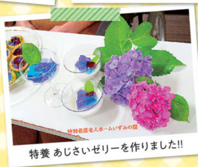
特養 あじさいゼリーを作りました!!