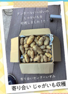
寄り合いじゃがいも収穫