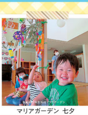
マリアガーデン セタ