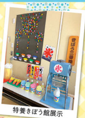
特養さばう館展示