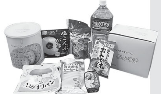
防災食の一例 (250名×3日分備蓄)