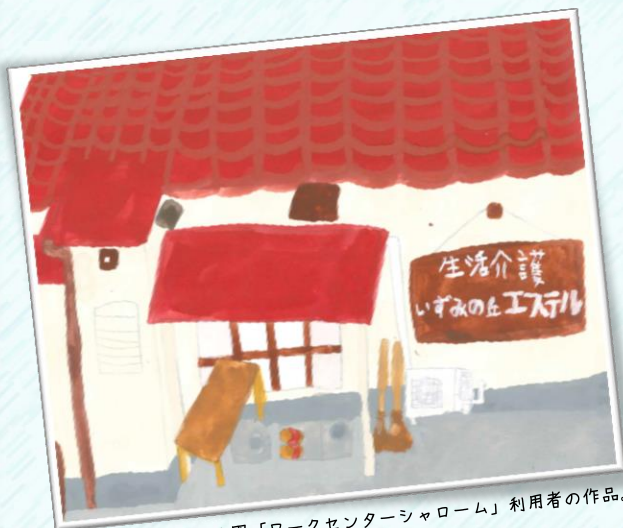
当園「ワークセンターシャローム」利用者の作品。